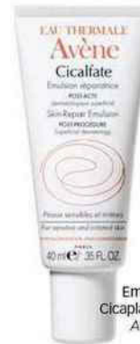
Emulsion Cicaplast, 8,30€, Avène.

Les hommes vont adorer la texture fluide du cultissime Cicaplast. Au cœur de sa formule, le sucralfate répare à tout-va et favorise une bonne humidité, le zinc et le cuivre assurent en tant qu'antibactériens tandis que l'eau d'Avène apaise illico. Idéal après tout acte esthétique pendant un mois.